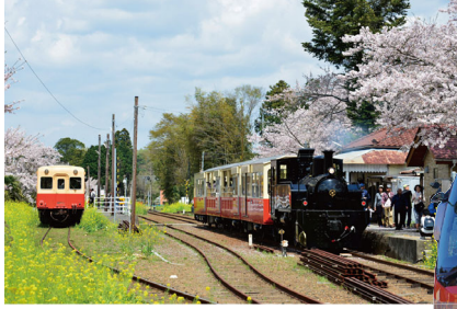
◀里山の四季を肌で感じる ことができる 「房総里山トロッコ列車」

一方でバス事業においては、いち早く高速バス全車両に自動ブレーキと走行中に車線から逸脱しそうな時に運転手に警報で知らせるシステムを搭載。また高速バスの乗務