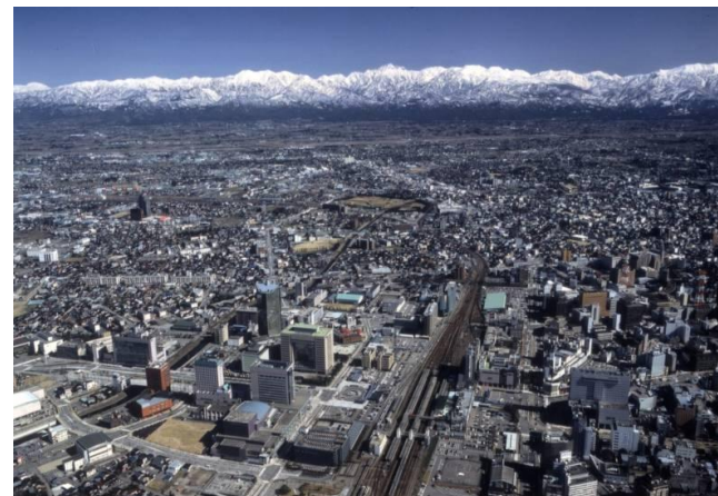
富山駅上空からみた市街地