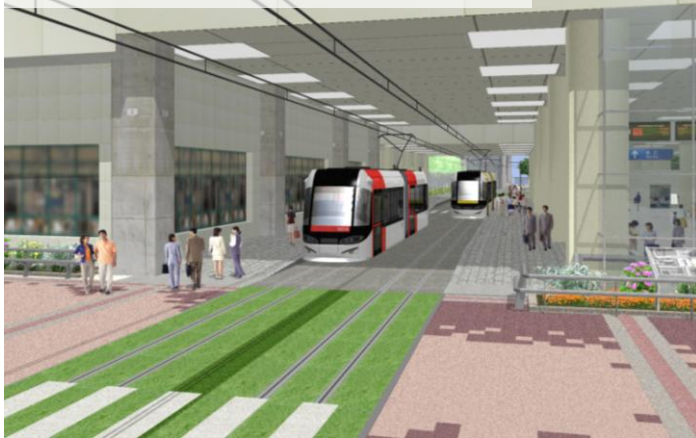
路面電車の南北接続(イメージ)