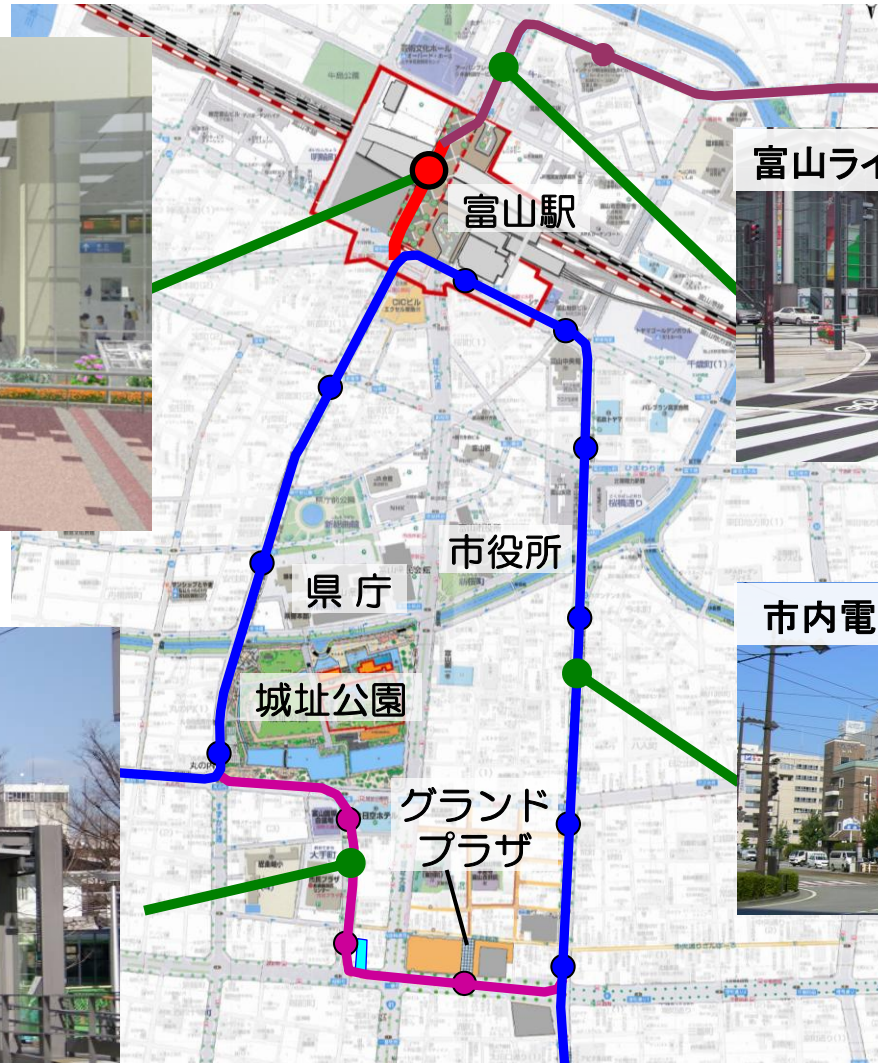
富山ライトレール